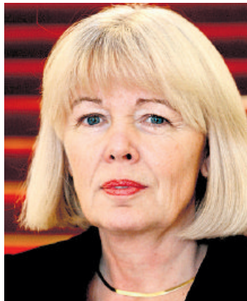
Kete Kervezee Foto WFA

„Nee. Scholen zijn bijvoorbeeld verplicht een meerjarenbegroting op te stellen en te verantwoorden, en een personeelsplan te maken. Scholen moeten subsidies aanvragen, bijvoorbeeld om het binnenmilieu te verbeteren, en die verbetering moet dan ook worden uitgevoerd. Maar het betreft ook on-